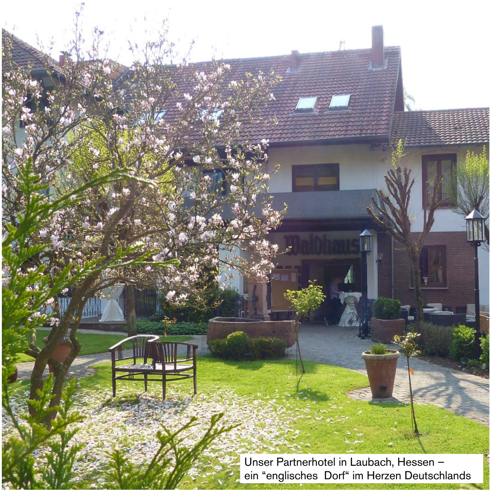
Unser Partnerhotel in Laubach, Hessen – ein “englisches Dorf” im Herzen Deutschlands